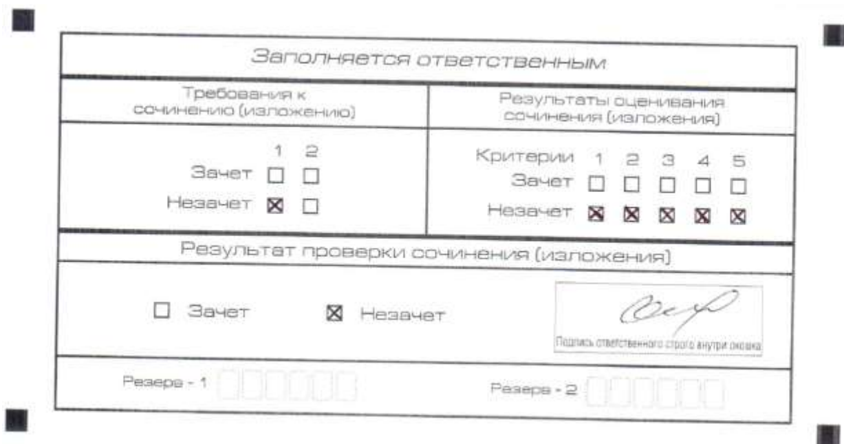
Рис. 5. Область для оценки работы

Эксперт комиссии (ответственное лицо) выставляет «незачет» за невыполнение требования № 2. В клетки по всем пяти критериям оценивания выставляется «незачет». В поле «Результат проверки сочинения (изложения) ставится «незачет».