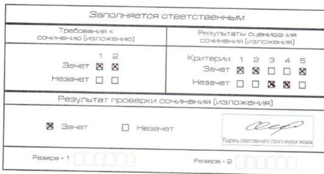
Рис. 6. Область для оценки работы

После окончания заполнения бланка регистрации ответственное лицо ставит свою подпись в специально отведенном для этого поле.